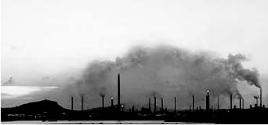
Foto van de dagelijkse normoverschrijding van chemische-, organische- en toxische stoffen met onherstelbare gezondheidsschade als gevolg

Los van de organisatie- en bestuurlijke criminaliteit, zijn deze 'State Criminals' mede verantwoordelijk voor de overtreding van fundamentele mensenrechten, misdaad tegen de mensheid en overtreding van de rechten van meer dan 5.500 kinderen.