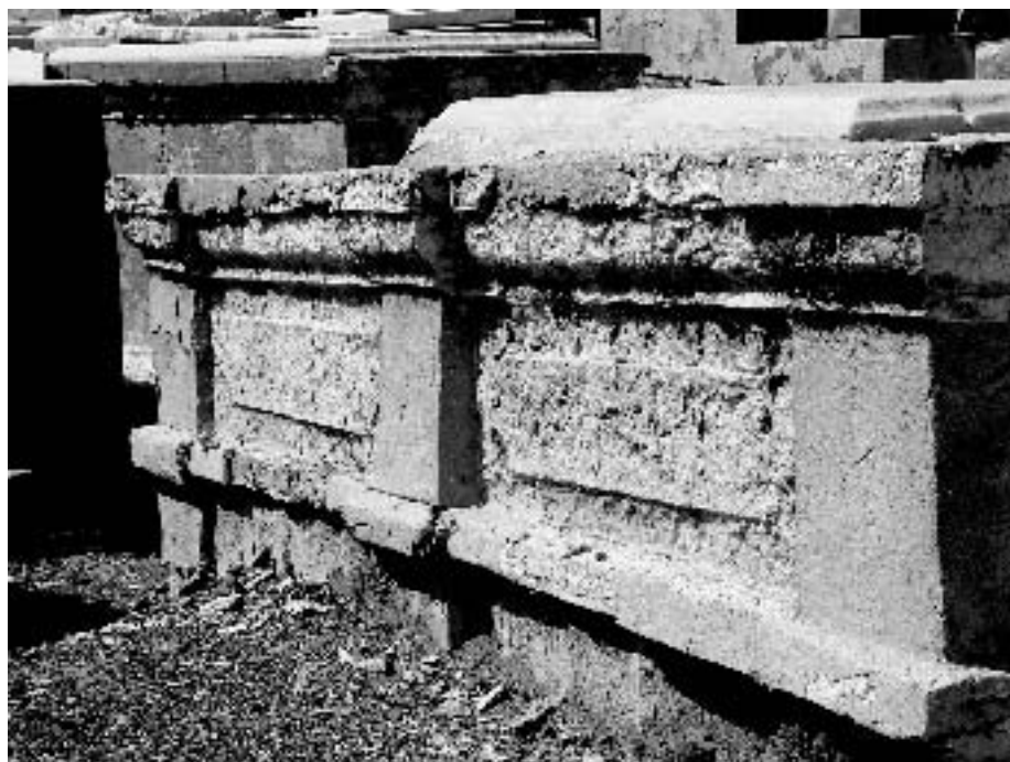
Foto van grafschennis in verband met de Joodse begraafplaats Beth Haim

Men kan zich afvragen wat de reactie zou zijn geweest als dit zich zou afspelen waar dan ook elders in de wereld. De Joodse gemeenschap rest niets anders dan het lijdzaam toezien hoe de rustplaats van haar voorouders wordt vernietigd.