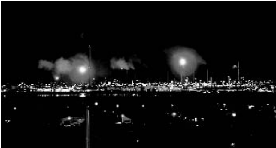
Foto van de nachtelijke normoverschrijding van chemische-, organische- en toxische stoffen met onherstelbare gezondheidsschade als gevolg

Los van de organisatie- en bestuurlijke criminaliteit, zijn deze 'State Criminals' mede verantwoordelijk voor de overtreding van fundamentele mensenrechten, misdaad tegen de mensheid en overtreding van de rechten van meer dan 5.500 kinderen.