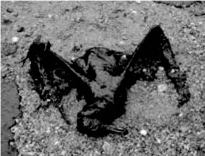
Foto van de gevolgen voor dieren die worden bedreigd door de met olie vervuilde Schottegatbaai en haar vertakkingen

Nogmaals, dat de Schottegatbaai uitmondt in de Caribische zee en daarmee in de internationale wateren schijnt geen issue te zijn. Immers, de daders staan boven de wet en het geïsoleerde karakter van Curaçao waarborgt dat de internationale gemeenschap niet gemakkelijk op de hoogte kan worden gebracht van háár belang dat ook wordt geschaad.