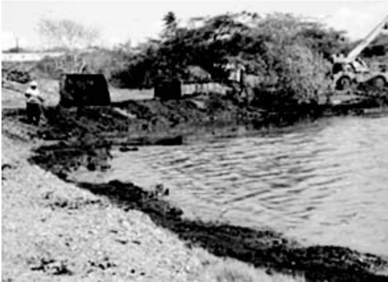
Foto van de met olie vervuilde Schottegatbaai die uitmondt in de Caribische zee en daarmee in internationale wateren

De verontreiniging van de Schottegatbaai is mensonterend. Door de verontreiniging met koelvloeistoffen is maritiem leven in de baai praktisch onmogelijk en de grote hoeveelheid olieresten bedreigen tal van diersoorten.